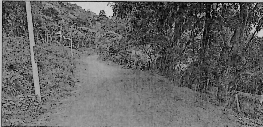
Imagen 1. Visita al predio indicado en el oficio, en las coordenadas 1.053.955 W, 875.110 N.

El día 15 de noviembre de 2022 se realizó visita a la vereda Montañuelas, corregimiento del Saladito, en las coordenadas 1.053.955 W, 875.110 N, coordenadas geográficas 03°27'59.99"N, 76°35'31.00"W, Santiago de Cali-Valle del Cauca Imagen 1.