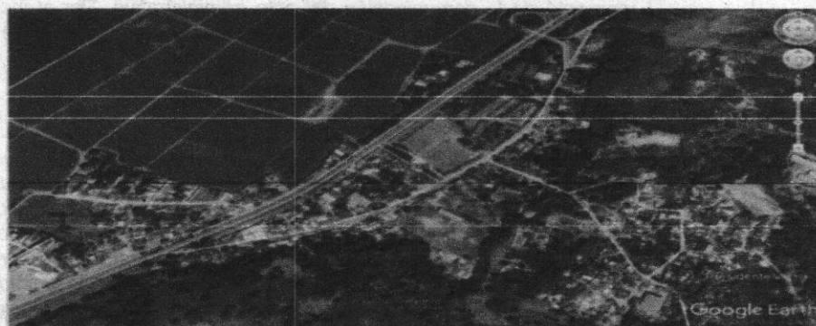
Imagen 1: ubicación del sitio (Geo portal Google Eath)