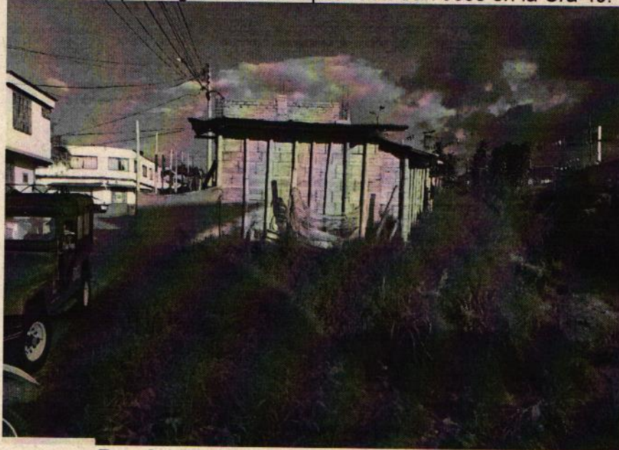
Foto 2. Vivienda en construcción en la Cra 49.