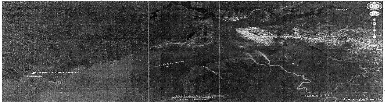
Imagen No. 1 Ubicación del del hotel con relación al distrito de Buenaventura. Google Earth. 2022

Sector Pianguíta, corregimiento de Bazán-Bocana, distrito de Buenaventura, departamento de Valle del Cauca, coordenadas geográficas (GCS-WCS-1984) 3°50'24.40" latitud norte, 77°11'53.47" longitud oeste, coordenadas planas (MAGNA - Colombia-Oeste) 916.392 metros norte, 986.596 metros este.