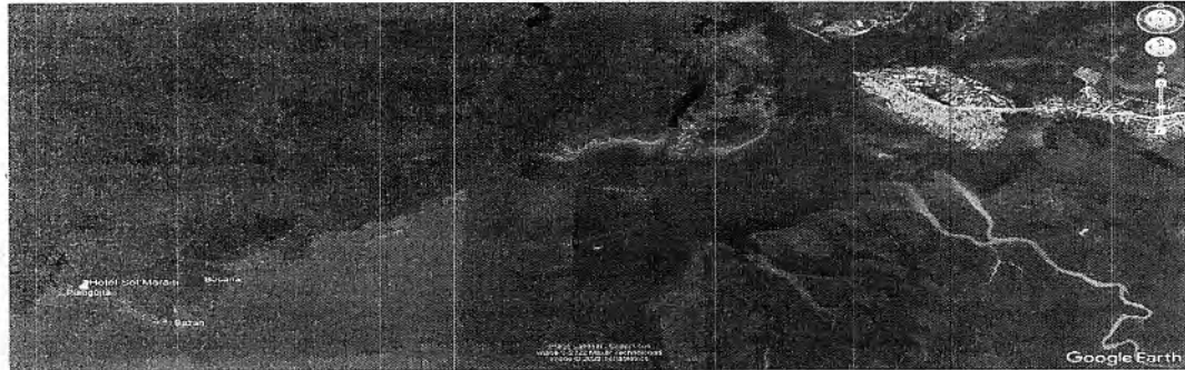
Imagen No. 1 Ubicación del del hotel con relación al distrito de Buenaventura.

Sector Piangüita, corregimiento de Bazán-Bocana, distrito de Buenaventura, departamento de Valle del Cauca, coordenadas geográficas (GCS-WCS-1984) 3°50'20.90" latitud norte, 77°11'52.79" longitud oeste, coordenadas planas (MAGNA – Colombia-Oeste) 916.284 metros norte, 986.617 metros este.