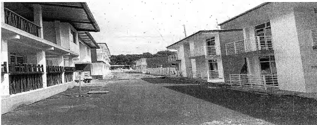
Foto No. 1 Vista general del establecimiento Hotel y Cabafias Aleluya, CVC. 2022.