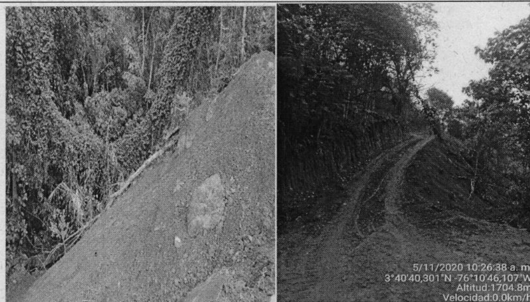
Foto No 3 y 4, se observa talud y la disposición inadecuada del material resultante de los cortes de la vía sobre la zona de alta pendiente lo que puede generar arrastre del mismo en épocas de lluvias fuertes y afectar la corriente de agua denominada El Loro en la parte baja.

Impactos generados con la apertura de la vía: