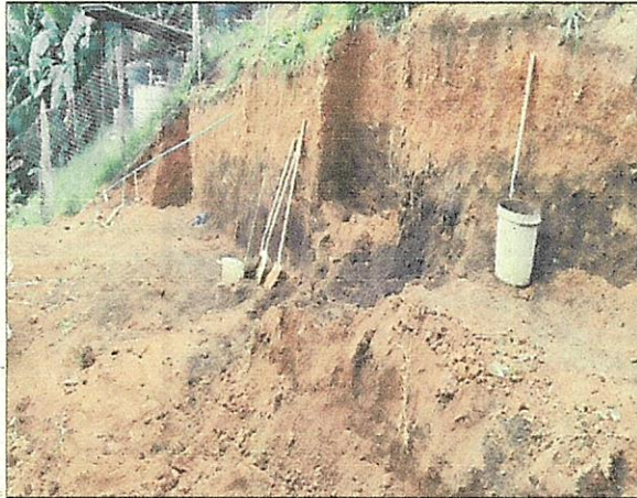
Imagen 3. Vista del talud máximo dejado en el terreno