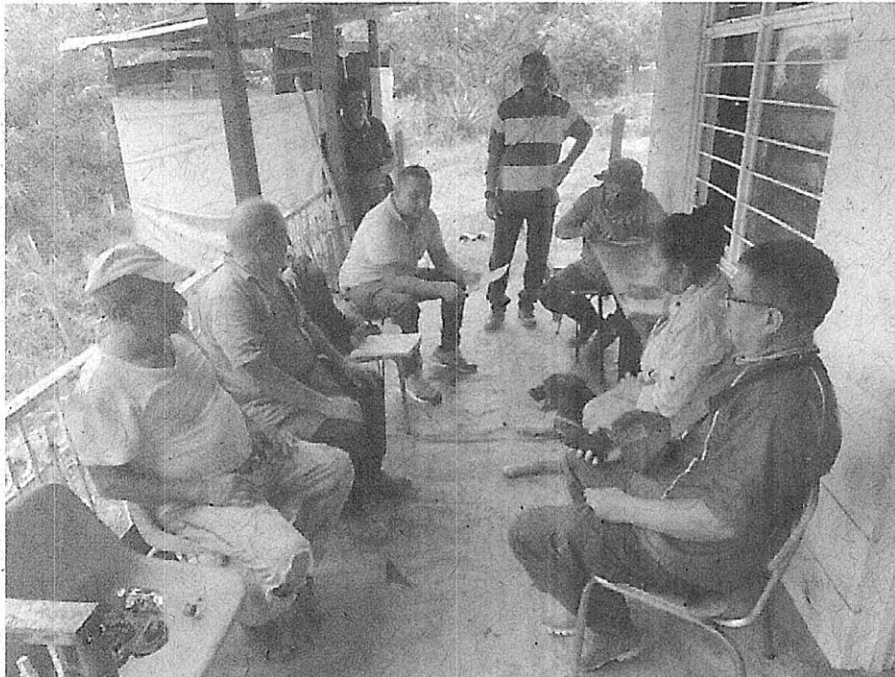
Fotografía 2: Diligencia de notificación, fuente propia 2023.

Mediante recorrido de control y vigilancia por el área de jurisdicción de la Unidad de Gestión de Cuenca: Lili- Meléndez – Cañaveralejo, de la Dirección Ambiental Regional Suroccidente de la C.V.C, en la fecha indicada; se lleva a cabo diligencia de notificación.