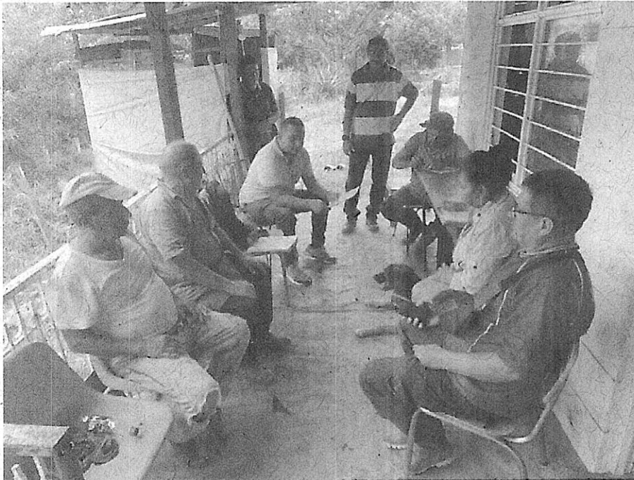
Fotografía 2: Diligencia de notificación, fuente propia 2023.

Mediante recorrido de control y vigilancia por el área de jurisdicción de la Unidad de Gestión de Cuenca: Lili- Meléndez – Cañaveralejo, de la Dirección Ambiental Regional Suroccidente de la C.V.C, en la fecha indicada; se lleva a cabo diligencia de notificación.