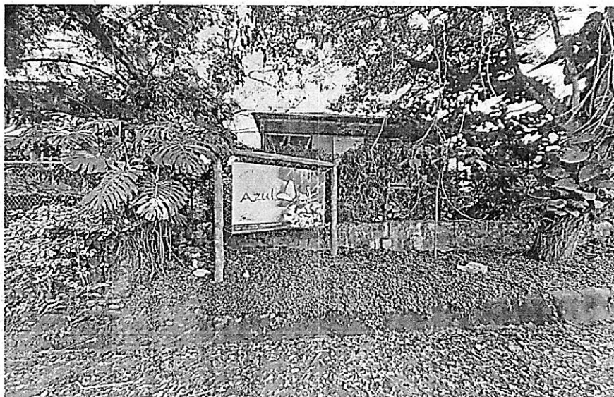
Imagen. Ubicación del lugar de la visita, diagonal al Mariposario. (Planas X=1.056.475 Y= 866.420).