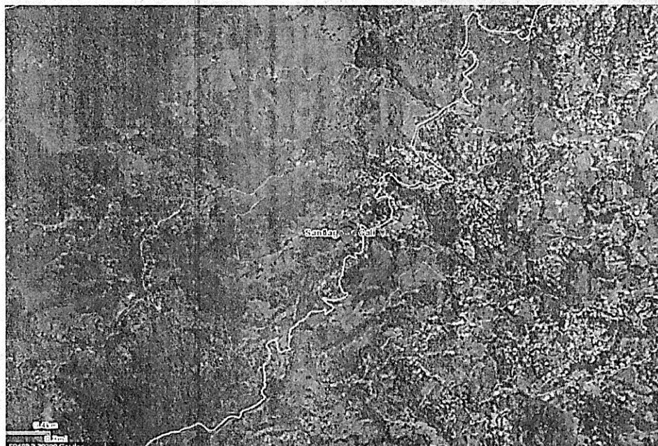
Mapa 1: Ubicación geográfica del lugar de la visita.

Jurisdicción del distrito de Cali, Corregimiento La Buitrera, paso La Reforma – Diagonal al Mariposario, Callejón Las Terrazas, Sector La Luisa, en inmediaciones con las coordenadas Latitud: 76.592777°N Longitud: 3.388055°O (Planas X=1.056.475 Y= 866.420).