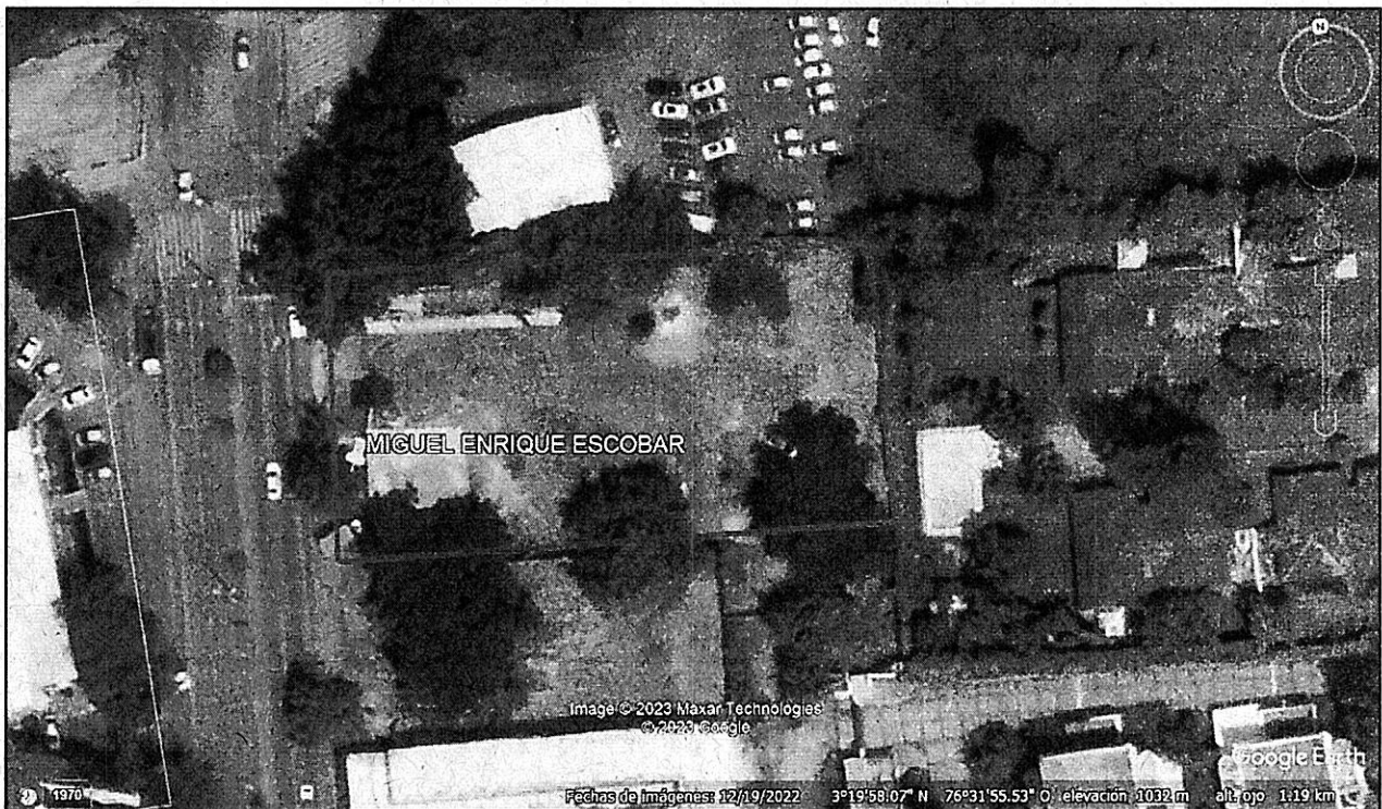
Imagen ubicación del predio Miguel Enrique Escobar

Avenida Cañas Gordas - Vereda La Viga - Corregimiento de Pance - coordenadas geográficas 3°19'58" Norte - 76°31'57" Oeste, Santiago de Cali - Valle del Cauca.