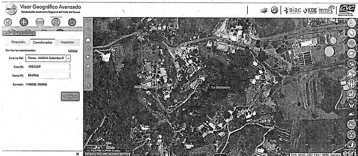
Mapa 1. Ubicación geográfica de la visita realizada.

Jurisdicción del Distrito de Cali, corregimiento de La Buitrera, Sector callejón Anchicayá, Inmediaciones de las coordenadas geográficas 3^{\circ}23'18,324'' N -76^{\circ}34'43,836'' y Planas X=1055269 E Y=866966 N