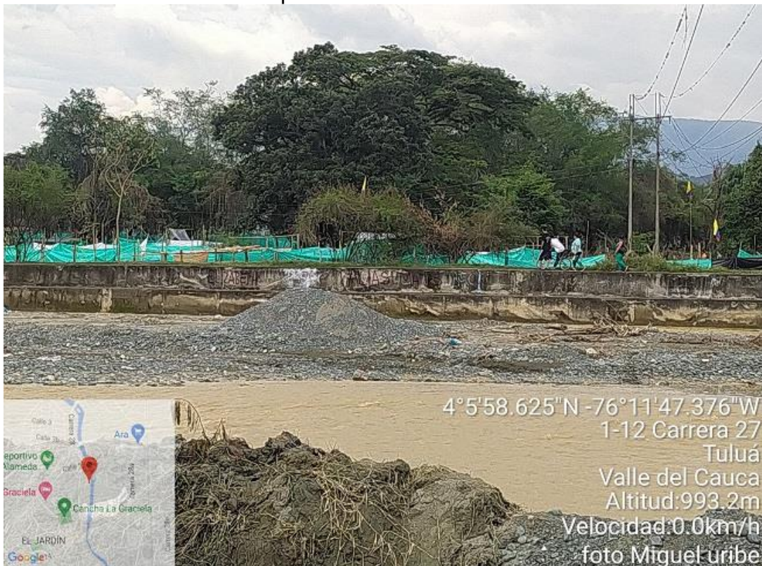
Imagen 2. Sitio objeto de la denuncia, Municipio de Tuluá.

En atención a denuncia anónima con radicado 523142023, funcionarios adscritos a la DAR Centro Norte, realizaron visita ocular al sitio indicado, al momento de la visita se pudo evidenciar la existencia de un asentamiento de desarrollo incompleto el cual se ubica sobre la margen derecha del río Tuluá a la altura del barrio la inmaculada, se observó la construcción de estructuras en guadua presuntamente para adecuar viviendas, las guaduas mencionadas al parecer se adquirieron de un rodal de guadua que se encuentra al interior del lote invadido. Desde el sitio que se pudo realizar la observación por parte de los funcionarios, no se evidencian impactos ambientales significativos que ameriten dar inicio a proceso sancionatorio, sin embargo, es competencia del Municipio de Tuluá realizar la atención al caso presentado por el asentamiento de desarrollo incompleto.