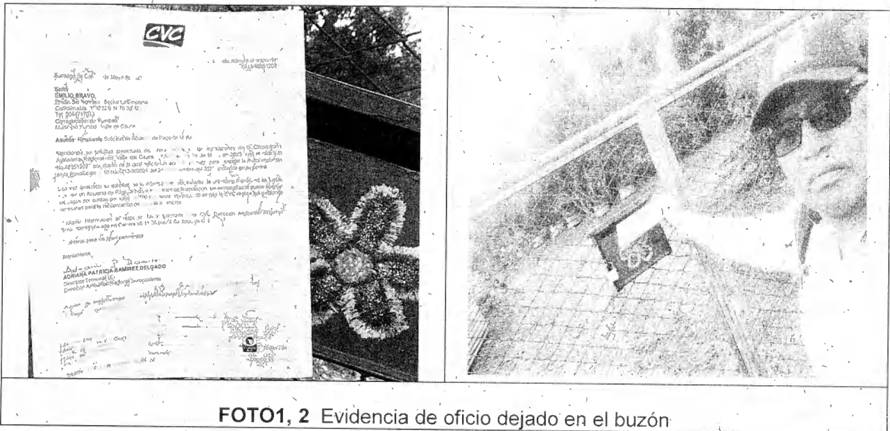
FOTO1, 2 Evidencia de oficio dejado en el buzón