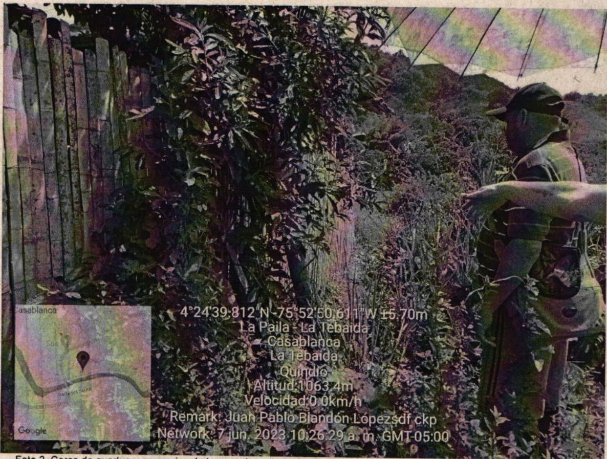
Foto 2. Cerca de guadua y cerca viva de la especie matarratón, que se encuentra en conflicto entre sus colindantes para su mantenimiento y uso.

No se observaron impactos ambientales significativos por el corte de los arbustos de matarratón.