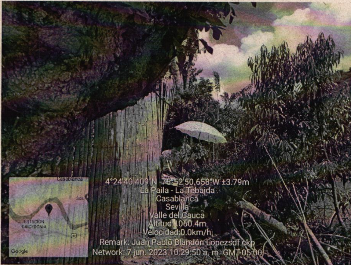
Foto 3. Poda y erradicación de arbustos de la especie matarratón dentro de la cerca colindante.

Corporación Autónoma Regional del Valle del Cauca