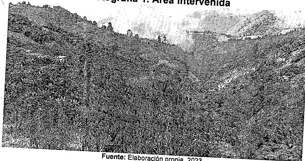
Fotografía 1. Área intervenida

material forestal resultante de la renovación del cafetal como leña para los fogones del predio.