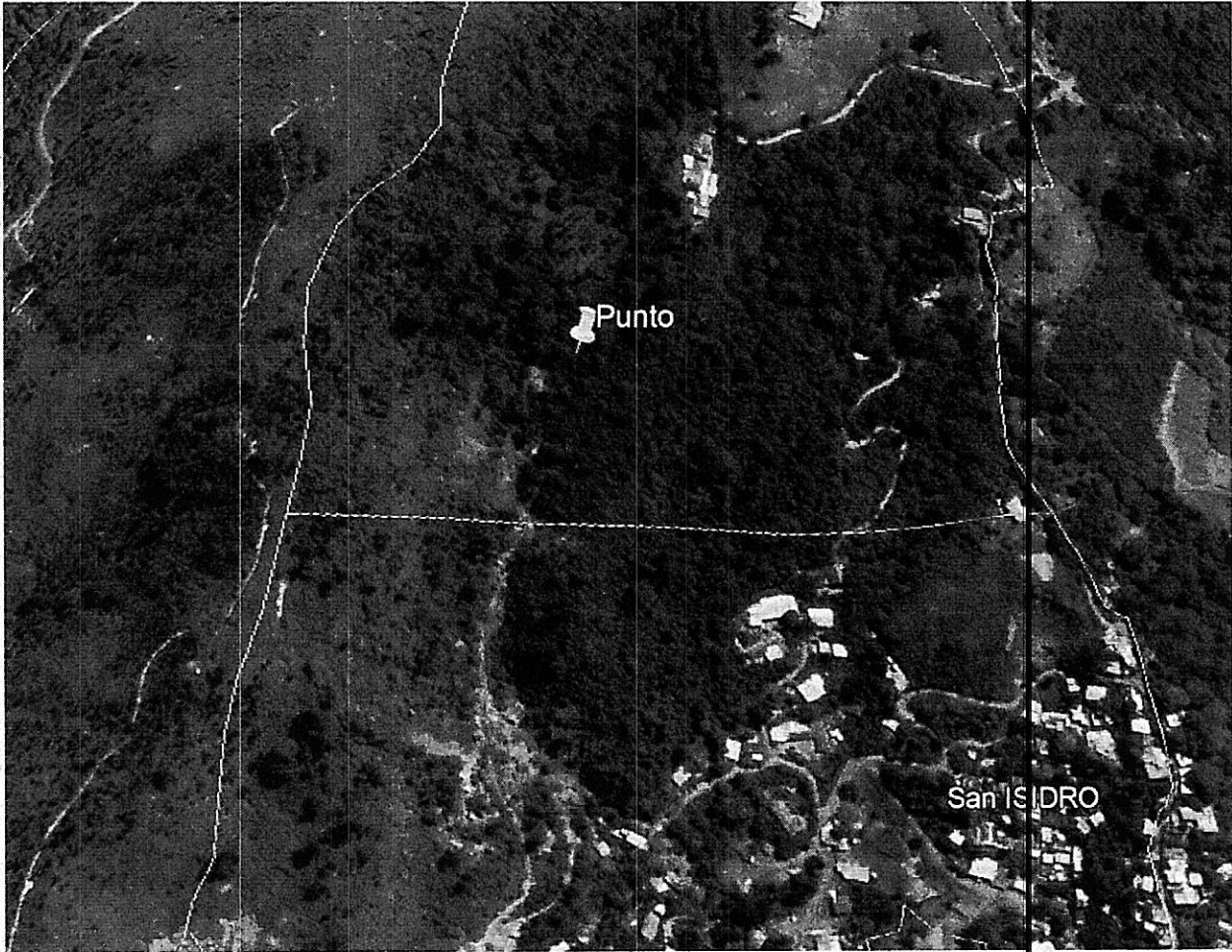
Imagen donde se muestra la ubicación del punto según coordenadas de los oficios

Corporación Autónoma Regional del Valle del Cauca