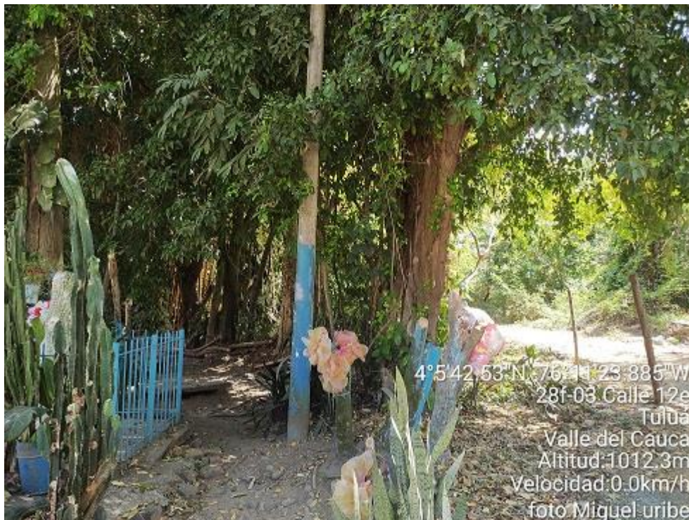
Imagen 2. Sitio objeto de la denuncia, Municipio de Tuluá.

Al momento de la visita no se encontraron personas realizando actividades de erradicación de árboles.