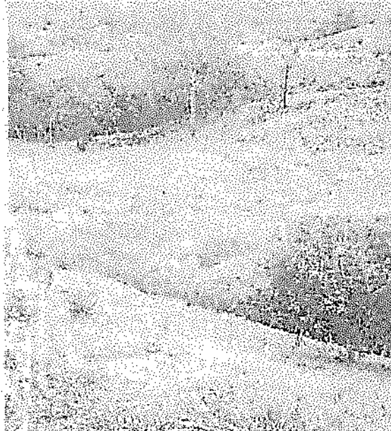
Fotografías 3 y 4. Vestigios de quemas controladas y demarcaciones de lotes con alambre de púas