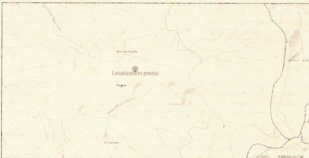
Figura 1. Localización predio Las vegas

Corregimiento de Borrero Ayerbe, municipio de Dagua, Departamento del Valle del Cauca, Coordenadas Planas Magna Colombia Oeste 1.050.551 Este (x), 885.428 Norte (y).