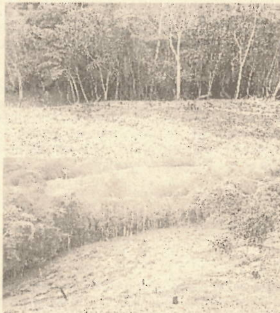
Fotografías 1 y 2. Vestigios de quemas controladas realizadas en el predio.