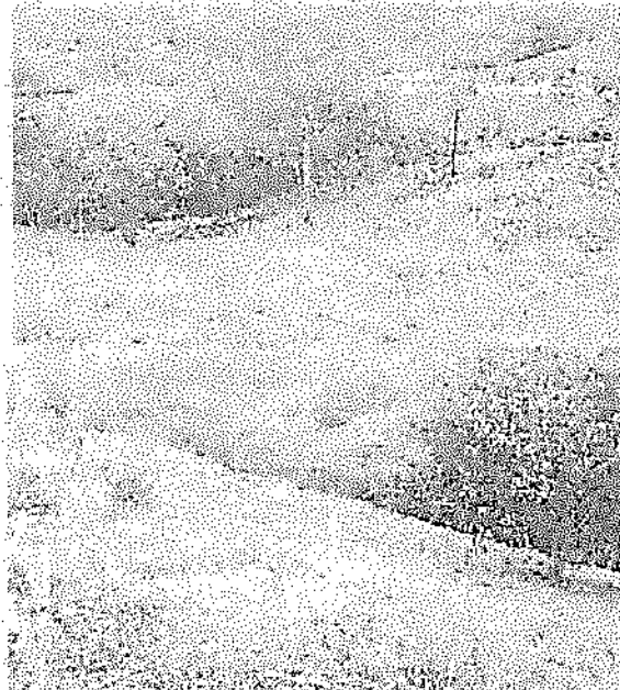
Fotografías 3 y 4. Vestigios de quemas controladas y demarcaciones de lotes con alambre de púas.

"POR LA CUAL SE IMPONE UNA MEDIDA PREVENTIVA DE SUSPENSIÓN DE ACTIVIDADES Y SE INICIA UN PROCESO SANCIONATORIO AMBIENTAL"