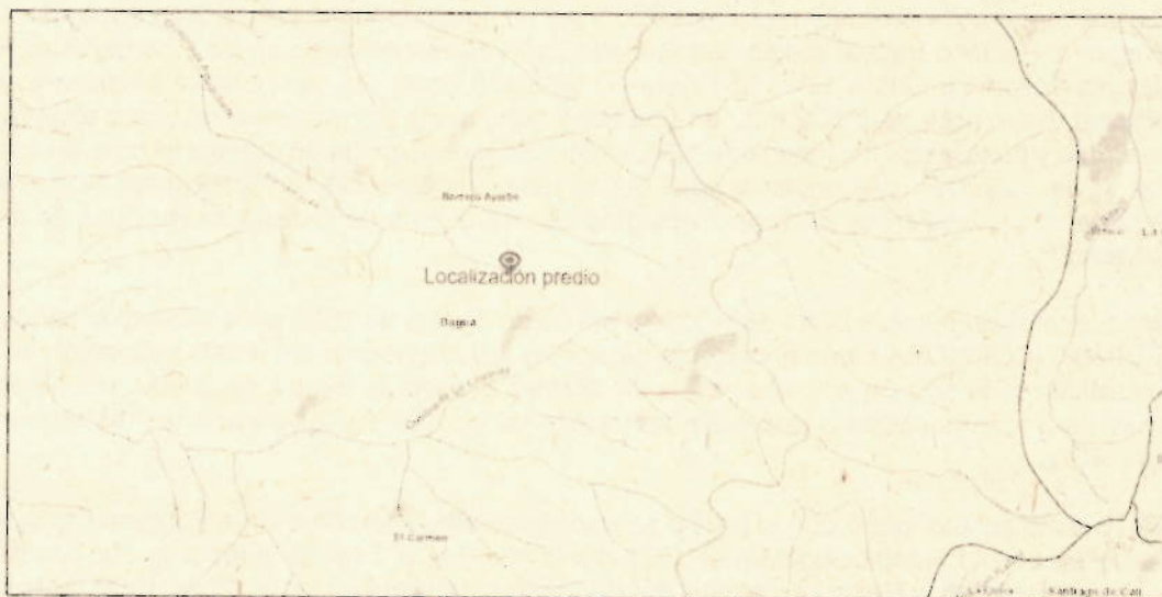
Figura 1. Localización predio Las vegas

Corregimiento de Borrero Ayerbe, municipio de Dagua, Departamento del Valle del Cauca, Coordenadas Planas Magna Colombia Oeste 1.050.551 Este (x), 885.428 Norte (y).