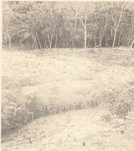
Fotografías 1 y 2. Vestigios de quemas controladas realizadas en el predio.