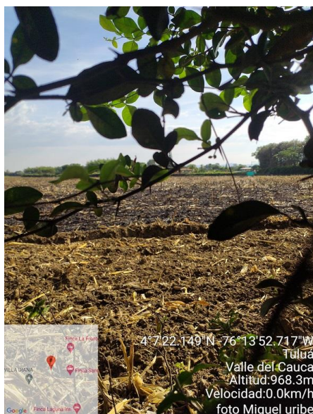
Imagen 1 Sitio objeto de la denuncia, Municipio de Tuluá.

Es de tener en cuenta que los predios donde se presenten incendios o eventos no programados, y que ocurran en forma recurrente, se harán acreedores a procedimientos administrativos e imposición de medidas y sanciones ya que es responsabilidad de los propietarios las situaciones relevantes ocurridas en su propiedad.