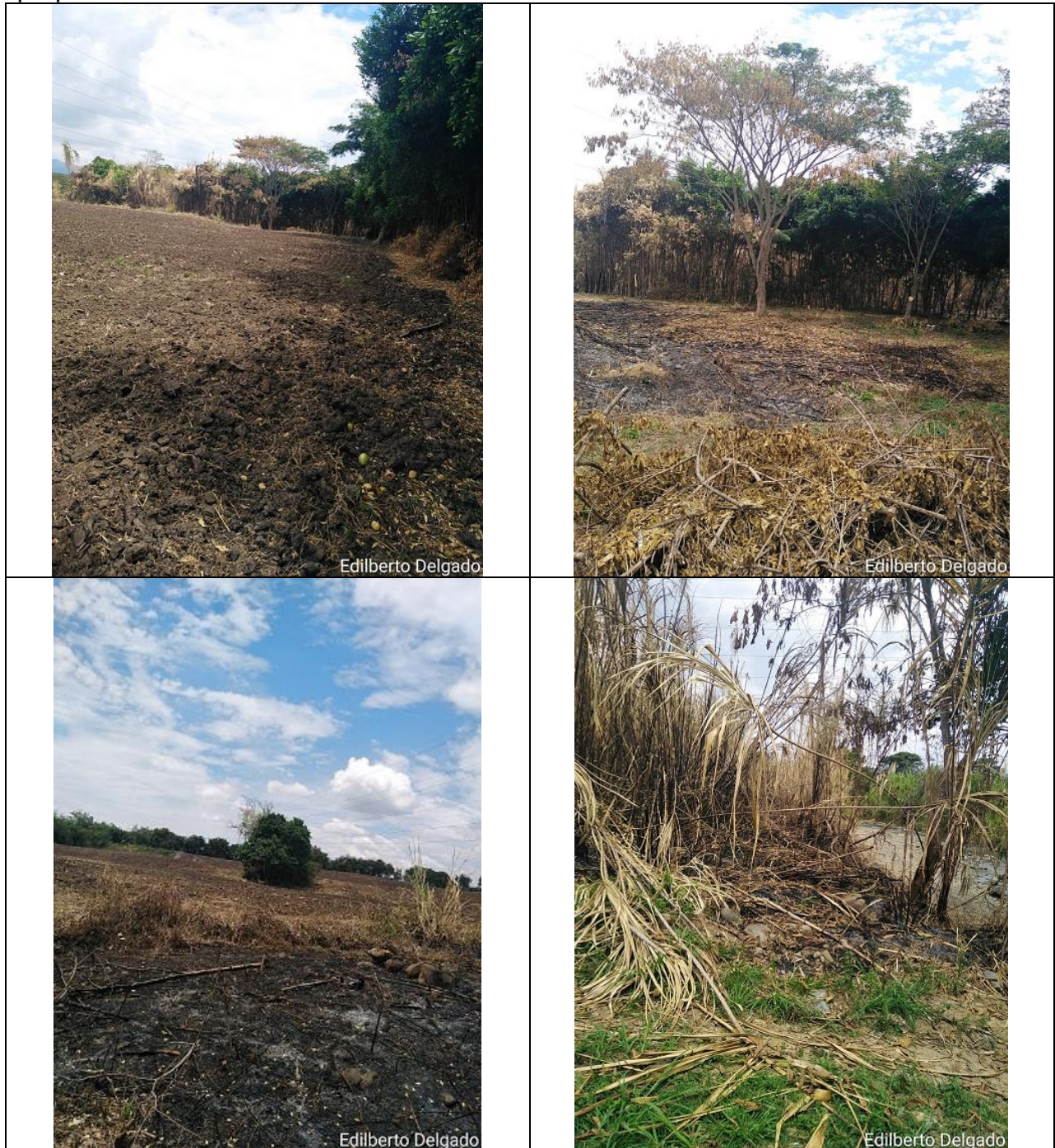
Imagen 3,4,5,6. Predio la Flora, sector la Santa Cruz, margen derecha del rio morales, zona forestal protectora afectada, Municipio de Tuluá.

Es de tener en cuenta que los predios donde se presenten incendios o eventos no programados, y que ocurran en forma recurrente, se harán acreedores a procedimientos administrativos e imposición de medidas y sanciones ya que es responsabilidad de los propietarios las situaciones relevantes ocurridas en su propiedad.