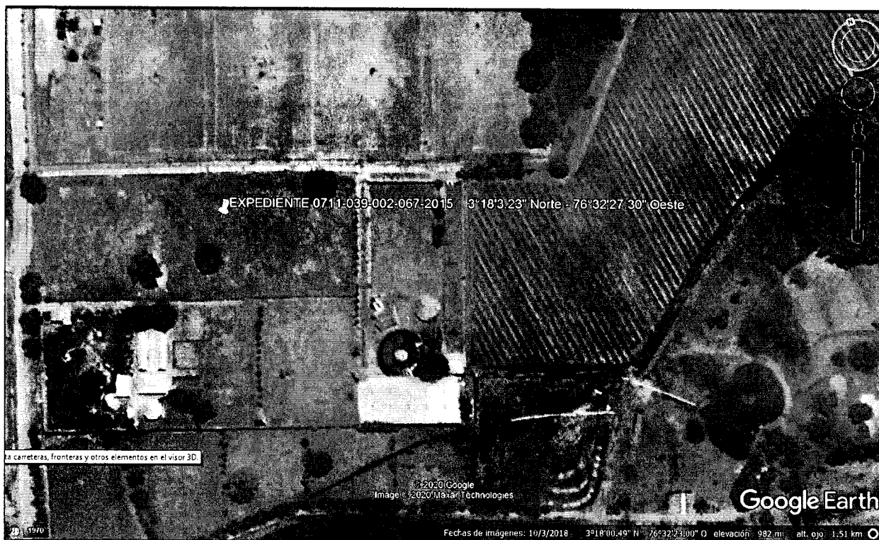
Imagen 1. Ubicación del predio

Predio ubicado en el sector de la Viga, del corregimiento de Pance, jurisdicción del municipio de Cali, al predio se llega tomando la vía que de Cali se llega a Jamundí, luego de pasar el puente de la Viga sobre el Rio Pance, en las coordenadas geográficas 3°18'3.23" Norte - 76°32'27.30" Oeste, al frente del Centro Deportivo Luz Mery Tristán se encuentra el predio.