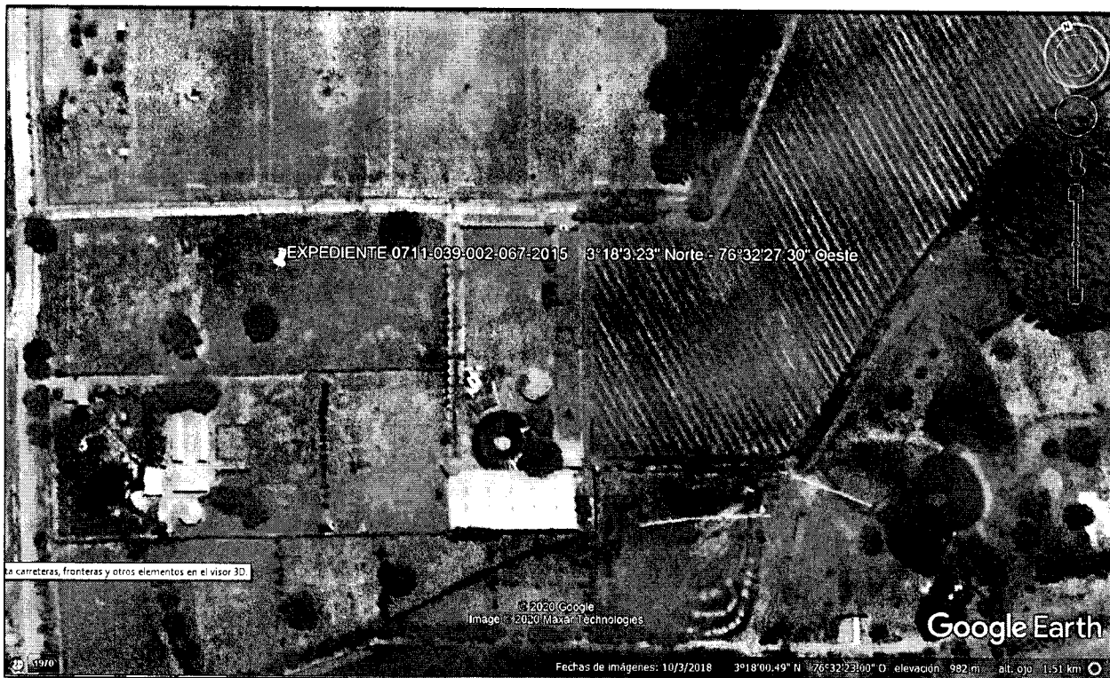
Imagen 1. Ubicación del predio

Predio ubicado en el sector de la Viga, del corregimiento de Pance, jurisdicción del municipio de Cali, al predio se llega tomando la vía que de Cali se llega a Jamundí, luego de pasar el puente de la Viga sobre el Rio Pance, en las coordenadas geográficas 3°18'3.23" Norte - 76°32'27.30" Oeste, al frente del Centro Deportivo Luz Mery Tristán se encuentra el predio.