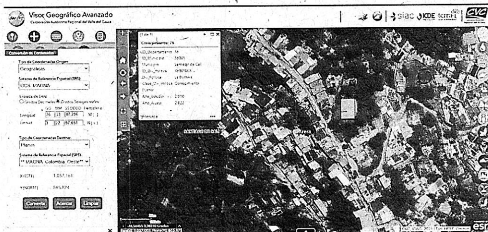
Mapa 1. Ubicación geográfica de la visita realizada. Fuente GeoCVC

Jurisdicción del Distrito de Cali, corregimiento de La Buitrera, Sector La Choclona, Inmediaciones de las coordenadas geográficas 3°22'57,651" N -76°33'47,286" OE y Planas X=1057161 E Y=865824 N