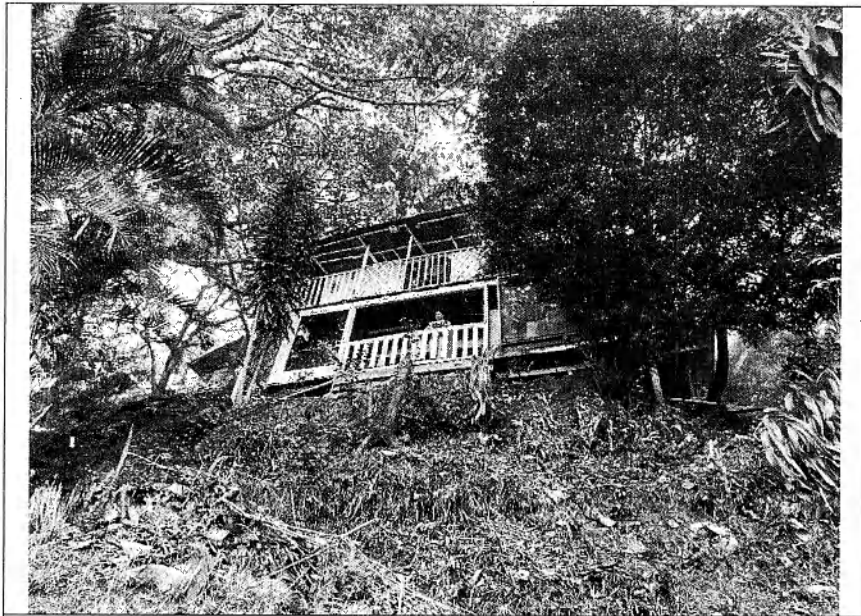
Imagen 1. Fotografía en la ubicación indicada en la notificación.

“RESOLUCIÓN 0710 No. 0712-002507 POE LA CUAL SE REVOCA UNA ACTUACIÓN ADMINISTRATIVA Y SE ADOPTAN OTRAS DISPOSICIONES”, sin embargo, en el momento de la visita no se encuentran personas en el predio que reciban la correspondencia y vecinos expresan no conocerlo.