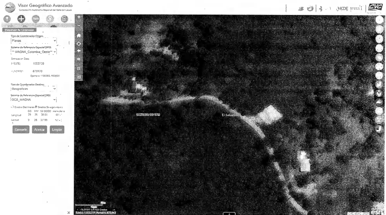
Mapa 1. Ubicación geográfica de la visita realizada.

Jurisdicción del Distrito de Cali, corregimiento de Saladito, Vereda Montañuelas, en las inmediaciones de las Coordenadas 3^{\circ}28'27.99''N 76^{\circ}35'38.01''W . (Planas X=1053738 Y=875970)