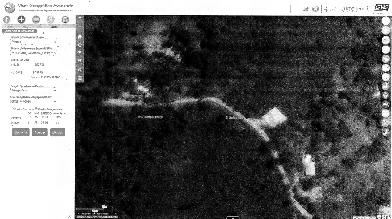
Mapa 1. Ubicación geográfica de la visita realizada.

Jurisdicción del Distrito de Cali, corregimiento de Saladito, Vereda Montañuelas, en las inmediaciones de las Coordenadas 3^{\circ}28'27.99''N 76^{\circ}35'38.01''W . (Planas X=1053738 Y=875970)