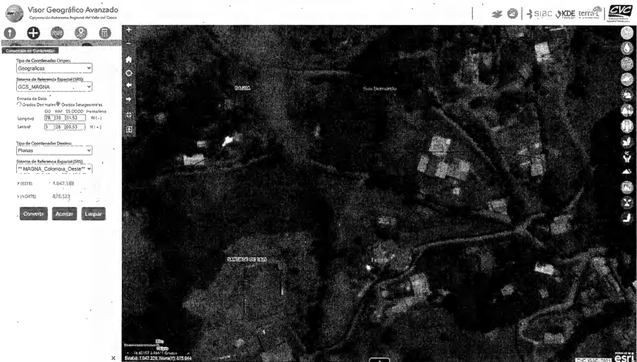
Mapa 1. Ubicación geográfica de la visita realizada.

Jurisdicción del Distrito de Cali, corregimiento de Felidia, Vereda El Diamante, en las inmediaciones de las Coordenadas 3^{\circ}28'00.53''N 76^{\circ}39'11.53''W . (Planas X=1047148 Y=875123 )