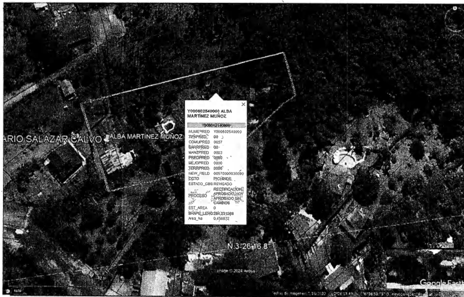
Fotografía 1: Ubicación predio SN.