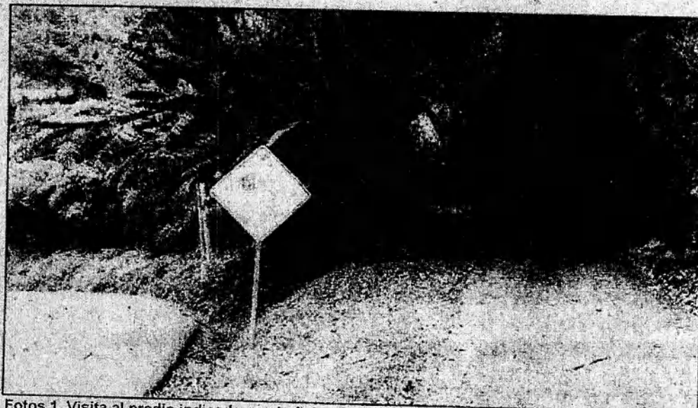
Fotos 1. Visita al predio indicado en el oficio, en las coordenadas 3^{\circ}28'46.54'' N, 76^{\circ}36'49.25'' W.

Se procedió a realizar entrega de las citaciones en las coordenadas suministradas en los oficios, sin embargo no se logró la entrega debido a que no se tuvo contacto con personas de los predios en esa ubicación, tampoco se logró información de los transeúntes al respecto (ver Fotos 1 y 2)