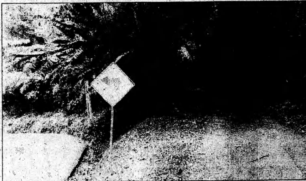
Fotos 2. Visita al predio indicado en el oficio, en las coordenadas 3°28'46.54" N, 76°36'49.25" W.

Corporación Autónoma Regional del Valle del Cauca