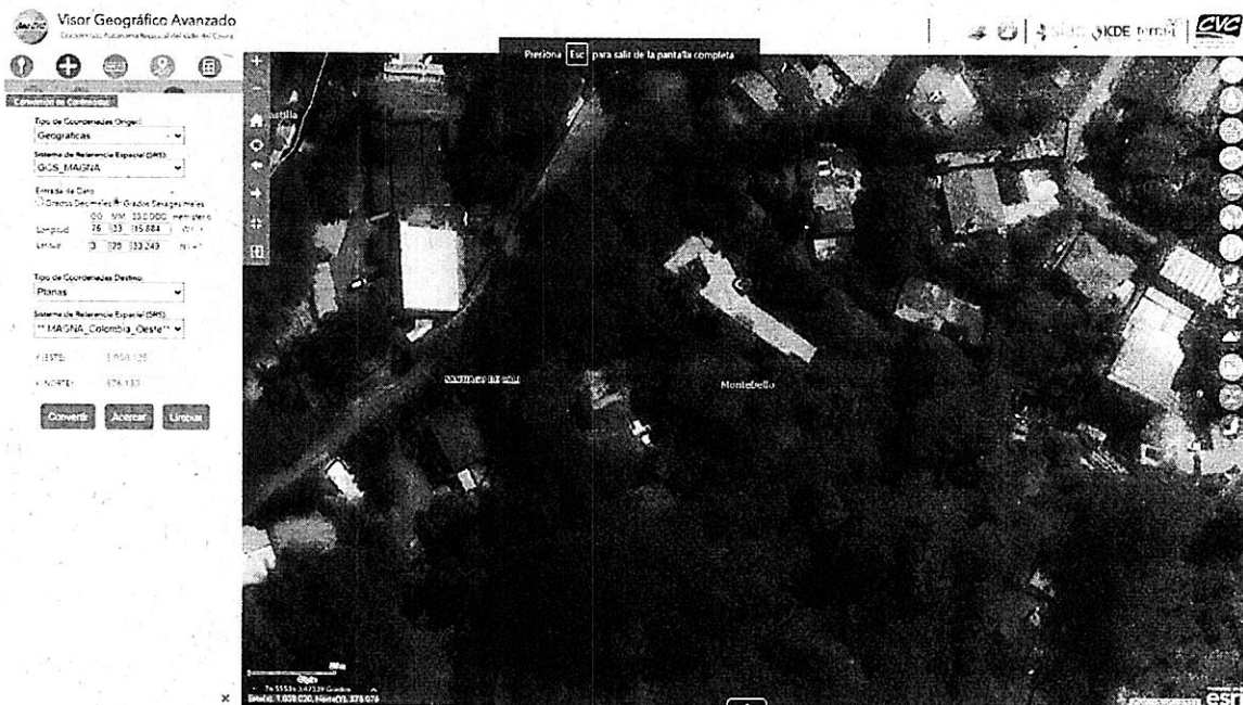
Mapa 1. Ubicación geográfica de la visita realizada.

Jurisdicción del Distrito de Cali, corregimiento de Montebello, Vereda Campo Alegre, en las inmediaciones de las Coordenadas 3^{\circ}28'33.249''N 76^{\circ}33'15.884''W . (Planas X=1058125 Y=876133)