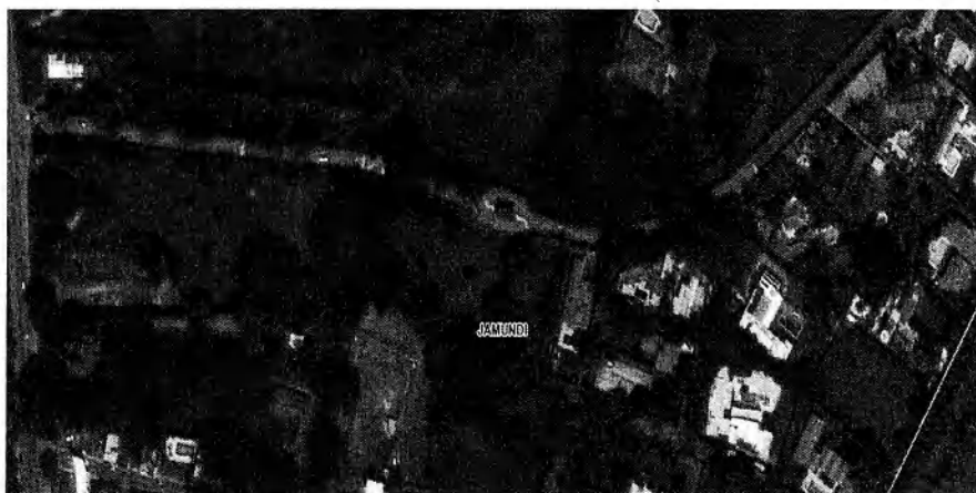
Imagen 1. Ubicación del condominio La Morada

Predio condominio Solares de la Morada Casa 5 etapa V y VI ubicado en Jamundí, en las coordenadas geográficas: 76°31'48,42" O 3°16'7,83" N