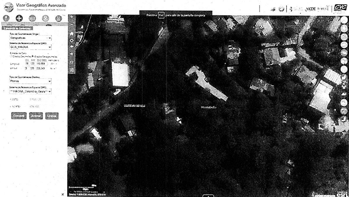
Mapa 1. Ubicación geográfica de la visita realizada. Fuente GeoCVC

Jurisdicción del Distrito de Cali, corregimiento de Montebello, Vereda Campo Alegre, en las inmediaciones de las Coordenadas 3^{\circ}28'33.249''N 76^{\circ}33'15.884''W . (Planas X=1058125 Y=876133)