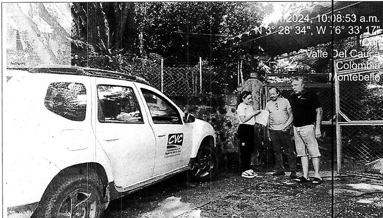
Imagen 1. Fotos de funcionarios en la portada del predio en donde se debe entregar la correspondencia.

sin embargo, en el momento de la visita el propietario del predio indica que no conoce a los señores Argemiro Coronado y Walter Álvarez Morales.