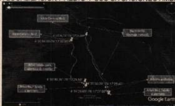
FIGURA LOCALIZACIÓN PREDIO Y SUS SITUACIONES AMBIENTALES