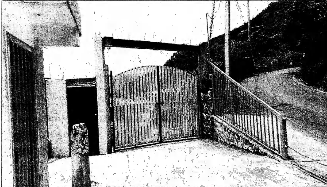
Fotos 2. Visita al predio indicado en el oficio, en las coordenadas 3°28'46.54" N, 76°36'49.25" W.

Corporación Autónoma Regional del Valle del Cauca