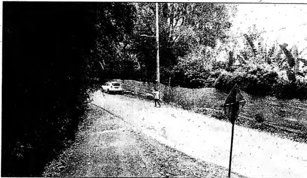
Fotos 1. Visita al predio indicado en el oficio, en las coordenadas 3°28'46.54" N, 76°36'49.25" W.

Se procedió a realizar entrega de las citaciones en las coordenadas suministradas en los oficios, sin embargo no se logró la entrega debido a que no se tuvo contacto con personas de los predios en esa ubicación. (ver Fotos 1 y 2).