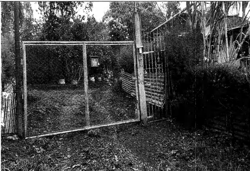
IMAGEN 3: Coordenadas Geográficas CGS – WGS 3°30'49.27" N - 76°33'28,932" W

Corporación Autónoma Regional del Valle del Cauca