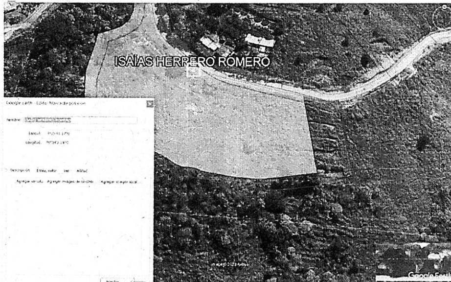
Fotografía 1: Ubicación predio, fuente: GeoCVC 2023.

Se realiza visita técnica al predio: "SN", que se ubica en inmediaciones de las coordenadas geográficas: N 3°25'41.17"O 76°34'2.19".