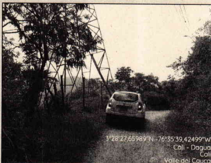
Fotos 1. Visita al sitio indicado en el oficio, en las coordenadas 1.053.738W, 875.970N, coordenadas geográficas 03°28'27.99"N, 76°35'38.01"W

Se realizó visita a la vereda Montañuelas, corregimiento del Saladito, en las coordenadas 1.053.738W, 875.970N, coordenadas geográficas 03°28'27.99" N, 76°35'38.01" W, Santiago de Cali-Valle del Cauca (ver foto 1).