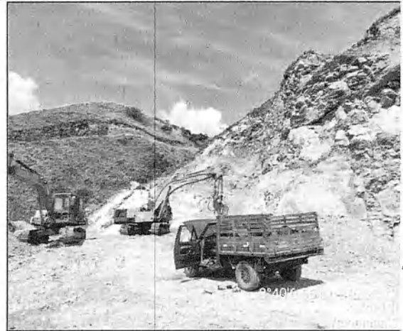
Fotografías 1 y 2. Se evidencia la mecanización de la extracción y la falta de terraceo

Es importante mencionar que, entre los dos frente o bloques, existe una quebrada denominada “Zanjón Seco”, la cual se podría ver afectada por los deslizamientos de material estéril producto de las erosiones; adicional a esto, se evidencia la cercanía de las actividades de extracción a la franja forestal protectora de la misma; por lo que se sugiere mantener la conservación de la distancia de los 30 metros lineales, según lo establece el Decreto 1076 del 2015.