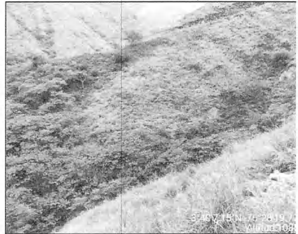
Fotografías 3 y 4. Se observa en la margen derecha la quebrada denominada “Zanjón Seco” y la cercanía del área de explotación a la Franja de Protección.

Con respecto a las demás obligaciones en cuanto a las medidas de manejo ambiental, se tiene que el abastecimiento de agua lo hacen por medio del acueducto veredal y las aguas residuales domésticas, son tratadas en un sistema localizado en la vivienda familiar de uno de los titulares; para el manejo paisajístico, se observa que se han realizado las reforestaciones en el área forestal protectora de la quebrada denominada "Zanjón Seco" y para los residuos, se cuenta con un punto ecológico en el frente de explotación, para la recolección de los mismo de forma temporal.