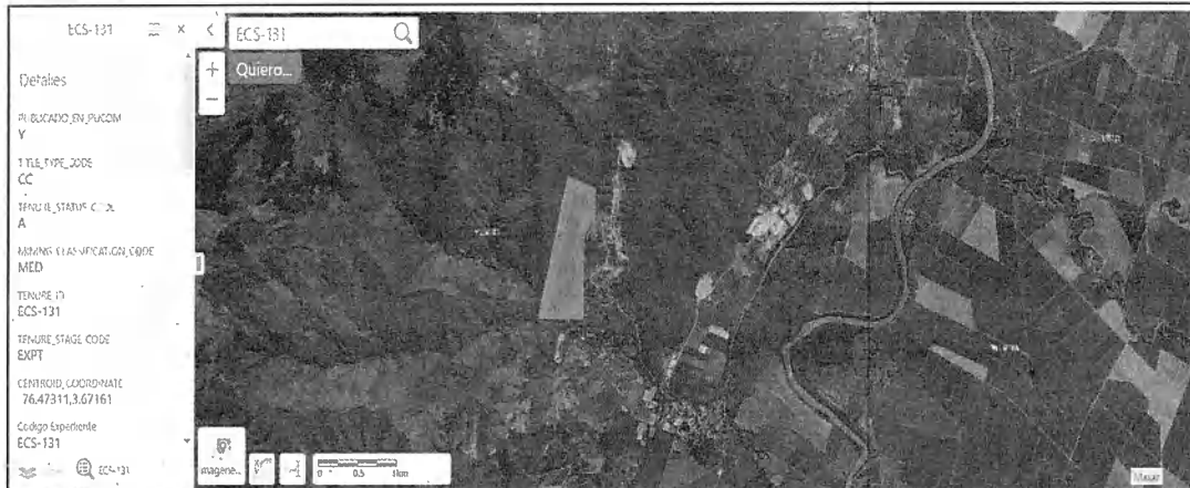
Figura 1. Ubicación del polígono minero del título ECS-131.

El título ECS-131 se localiza en la vereda Manga Vieja, corregimiento de San Marcos, municipio de Yumbo en inmediaciones de las Coordenadas geográficas 3°40'6.551" N -76°28'19.621" W del sistema de referencia WGS84 y se ubica en la plancha topográfica del IGA 280 -III - A.