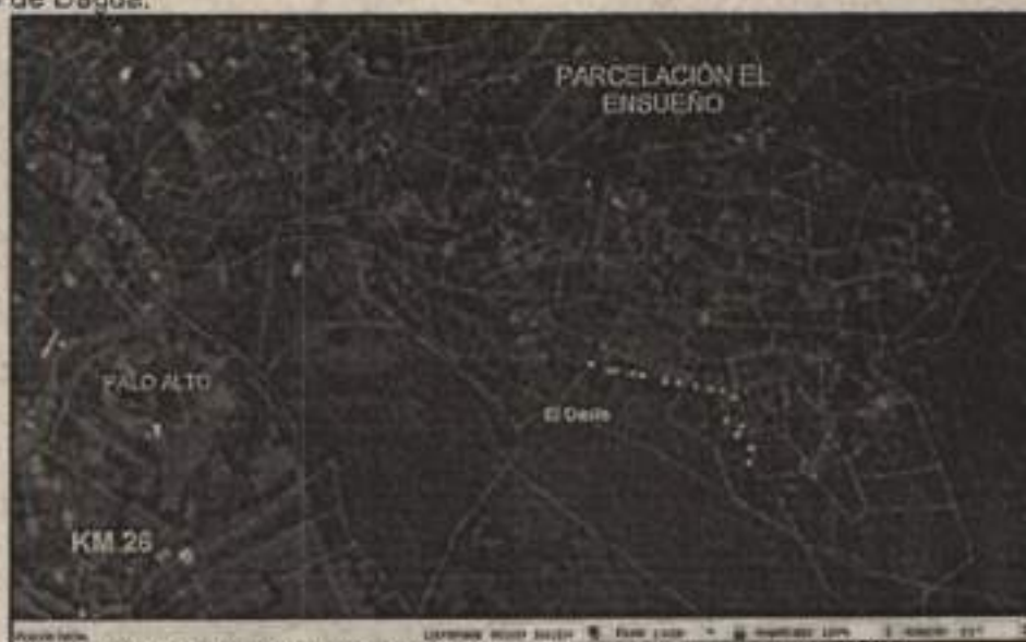
Mapa 1 Vista en planta, localización del predio El Llano.

Predio denominado El Oasis, identificado con matrícula inmobiliaria No. 370-775885, con número de Referencia Catastral Anterior: 76233000200021634000, localizado en el Corregimiento de Borrero Ayerbe sector de la finca Palo Alto en el KM 26 de la vía Cali-Dagua, jurisdicción del municipio de Dagua.