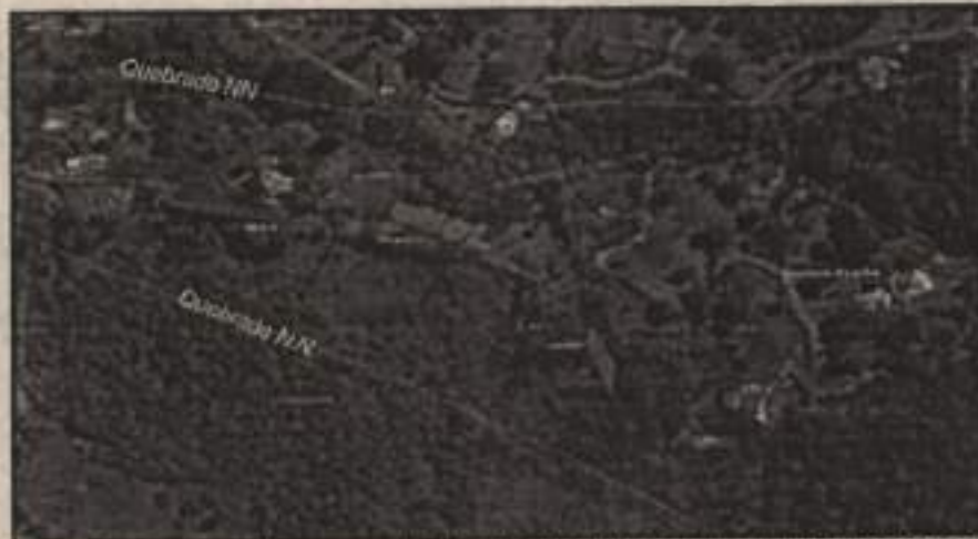
Localización del tramo carretable y las tres explanaciones de reciente construcción en el predio El Oasis.

"POR LA CUAL SE IMPONE UNA MEDIDA PREVENTIVA DE SUSPENSIÓN DE ACTIVIDADES Y SE TOMAN OTRAS DETERMINACIONES."