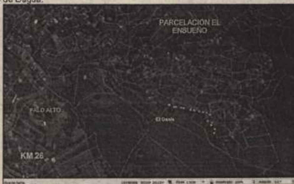
Mapa 1 Vista en planta, localización del predio El Liano.

Predio denominado El Oasis, identificado con matrícula inmobiliaria No. 370-775885, con número de Referencia Catastral Anterior: 76233000200021634000, localizado en el Corregimiento de Borrero Ayerbe sector de la finca Palo Alto en el KM 26 de la vía Cali-Dagua, jurisdicción del municipio de Dagua.