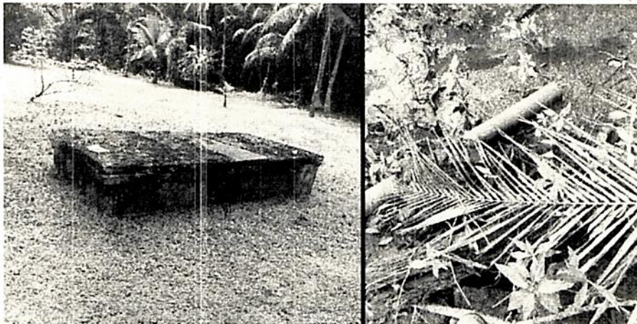
Foto N° 2. Planta general del sistema de tratamiento y tubería de descarga del efluente final.

El sistema de tratamiento construido y operando que recibe las aguas residuales del bloque de color verde cuenta con dimensiones de 3.4 mts de largo, 1.7 mts de ancho y una altura útil aproximada de 1.6 mts para un volumen de 9.25 m 3 y el tanque séptico que recibe las aguas residuales de los bloque naranja y amarillo cuenta con de 4.1 mts de largo, 2.2 mts de ancho y una altura útil aproximada de 2.0 mts para un volumen de 18.04 m 3 .