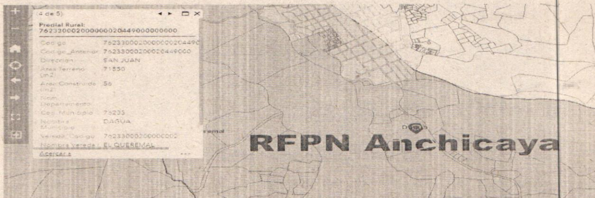
Imagen 3. Identificación del predio donde se realiza la actividad.

Una vez verificadas las coordenadas tomadas en campo y la información disponible en la capa de catastro predial Rural del IGAC, se determinó que el predio en mención donde se identificaron las actividades de construcción se encuentra ubicado identificado como SAN JUAN con código predial Nacional No 76233000200000002044900000000. Posteriormente se revisa la ubicación del predio con respecto a la capa de áreas protegidas del orden nacional y regional, verificando que el predio se encuentra al interior de la Reserva Forestal Protectora Nacional del Río Anchicayá, como se evidencia en la imagen 3.