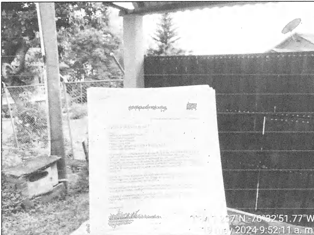
Fotografía 1. Ubicación del predio e intento de entrega del oficio.

Se realizan dos (2) intentos de entrega de la notificación por aviso 0713-353992024, no ha sido posible realizar dicha entrega debido a que el predio no se ha encontrado personas que reciban la comunicación.