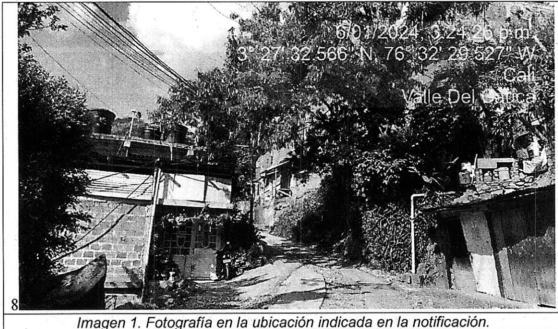
Imagen 1. Fotografía en la ubicación indicada en la notificación.

Corporación Autónoma Regional del Valle del Cauca