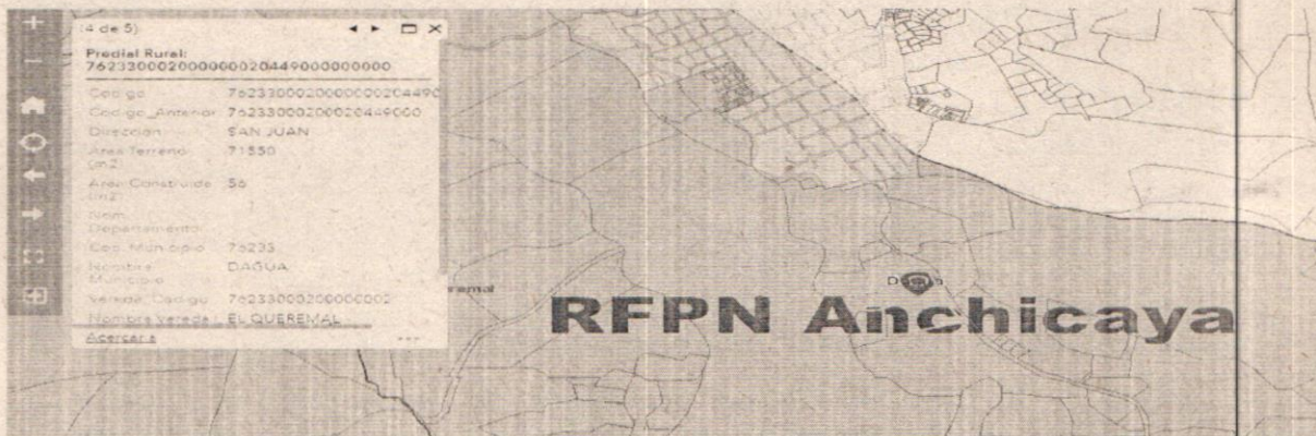
Imagen 3. Identificación del predio donde se realiza la actividad.

Una vez verificadas las coordenadas tomadas en campo y la información disponible en la capa de catastro predial Rural del IGAC, se determinó que el predio en mención donde se identificaron las actividades de construcción se encuentra ubicado identificado como SAN JUAN con código predial Nacional No 762330002000000020449000000000. Posteriormente se revisa la ubicación del predio con respecto a la capa de áreas protegidas del orden nacional y regional, verificando que el predio se encuentra al interior de la Reserva Forestal Protectora Nacional del Río Anchicayá, como se evidencia en la imagen 3.