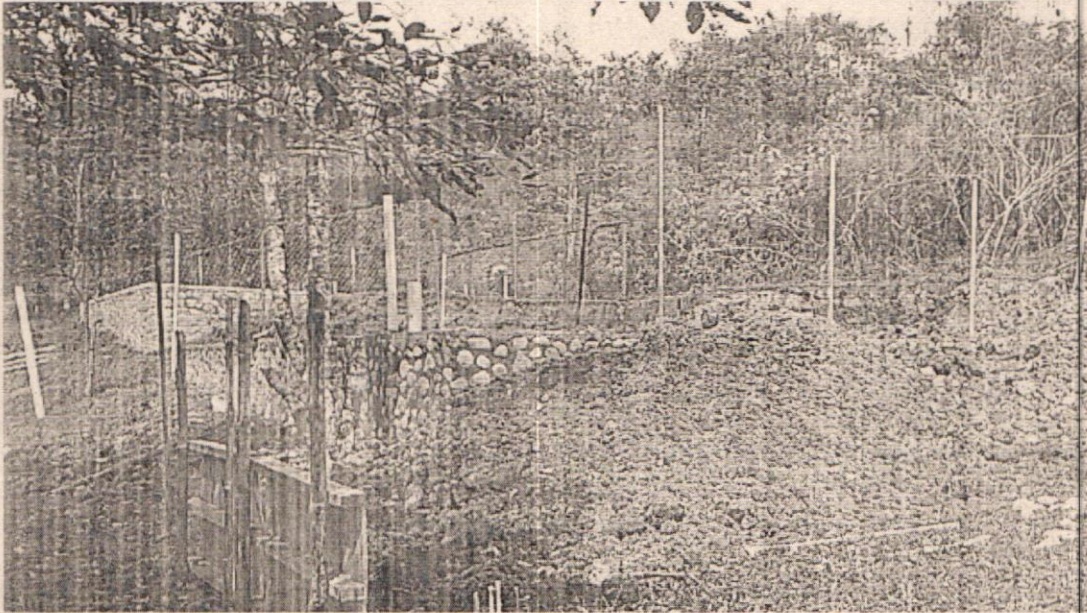
Imagen 2. Identificación de las actividades de Movimiento de tierra y construcción de vivienda encontrada. (Foto tomada con cámara celular del Funcionario German Estiven Garnica en Agosto 19 de 2020)

Una vez verificadas las coordenadas tomadas en campo y la información disponible en la capa de catastro predial Rural del IGAC, se determinó que el predio en mención donde se identificaron las actividades de construcción se encuentra ubicado identificado como SAN JUAN con código predial Nacional No 762330002000000020449000000000. Posteriormente se revisa la ubicación del predio con respecto a la capa de áreas protegidas del orden nacional y regional, verificando que el predio se encuentra al interior de la Reserva Forestal Protectora Nacional del Río Anchicayá, como se evidencia en la imagen 3.