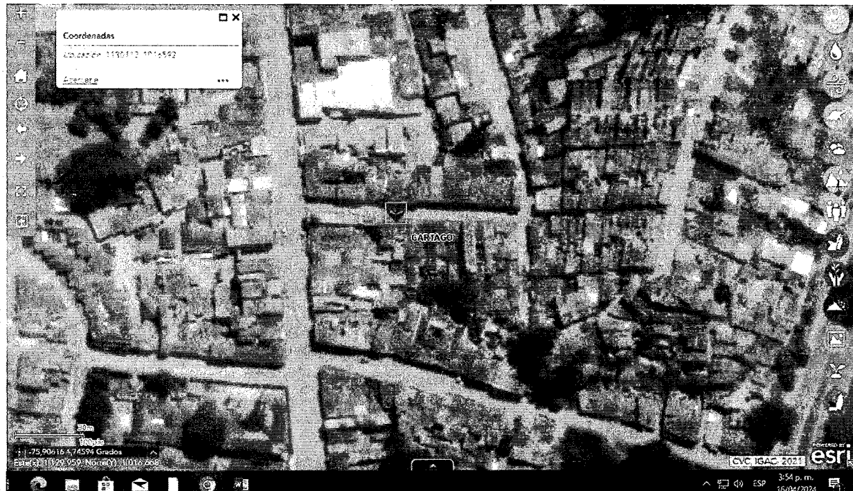
IMAGEN 1. LOCALIZACIÓN DEL PREDIO OBJETO DENUNCIA

Carrera 10 No. 3-141, barrio Camellón del Quindío, municipio de Cartago, departamento del Valle del Cauca, en la jurisdicción territorial de la subcuenca hidrográfica La Vieja-Obando.