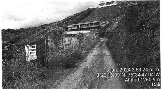
Foto 1. Zona recorrida para entrega de notificación.