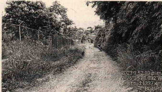
Foto 1. Zona recorrida para entrega de notificación.